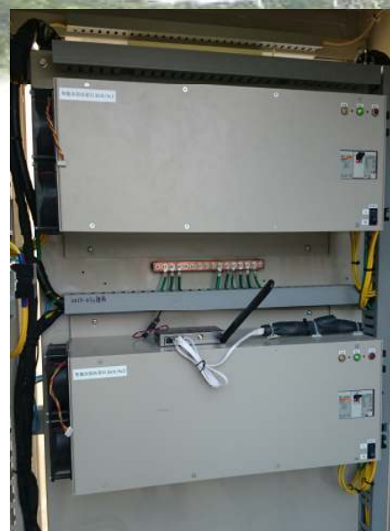
設置写真(12kWx2 台の場合)